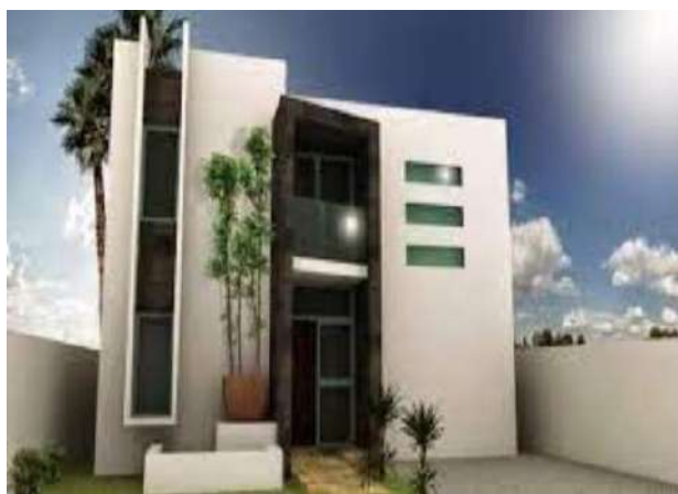
CASA O APARTAMENTO

Todas las personas deben estar de pie, la fotografía debe ser tomada de manera horizontal y debe vérsela totalidad del cuerpo (no deben tener ninguna parte del cuerpo recortada) como se muestra en el ejemplo.